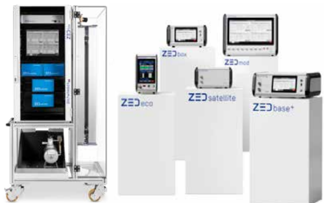
ZEDflex mit ZEDcontrol